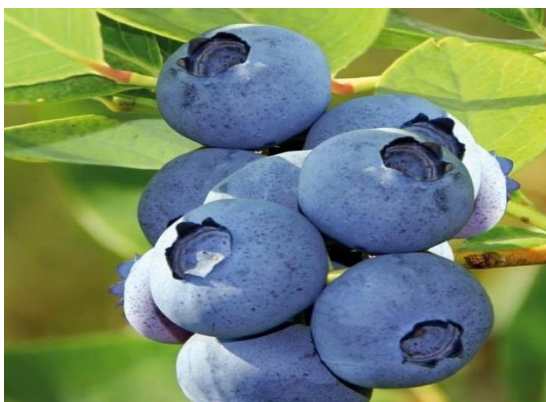
Owoce borówki wysokiej do ekstrakcji